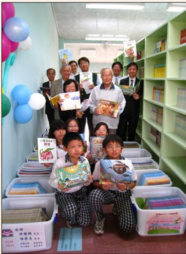
圖：地方熱心人士捐贈書箱，成立書庫。 2013/3/19(台南市麻豆區培文國小愛的書庫)