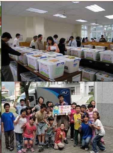
圖：新竹物流公益運送書箱，讓好書無遠弗屆。