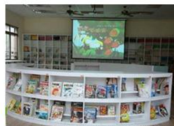
館內科技融入設備及圖書館教育