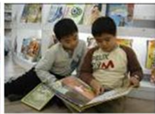
圖書館營造隨處都能閱讀，或坐或躺或站，自在閱讀的氛圍