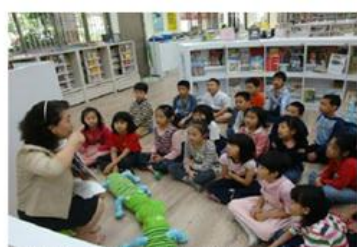
館內師生互動及對話閱讀區

推動我為人人情操，擴大訓練圖書館志工，設計服務志工介紹牌，依輪班志工隨時替換照片姓名牌，讓學生可以認識為我們服務的人，同時也提高志工的榮譽感和對圖書館的歸屬感。