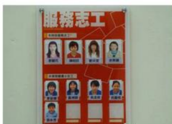
圖書館社區及學生志工