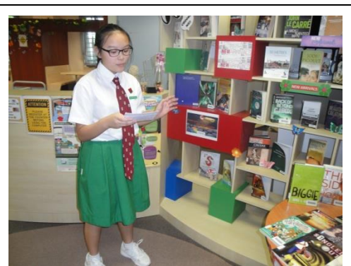
小志工帶領介紹圖書館