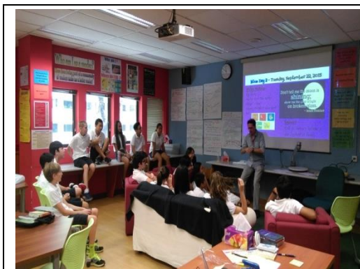
觀課---自由入座上課情形