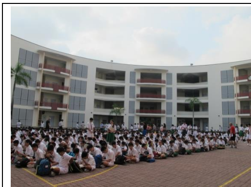
廣場上自由晨讀---戴領帶的領導人