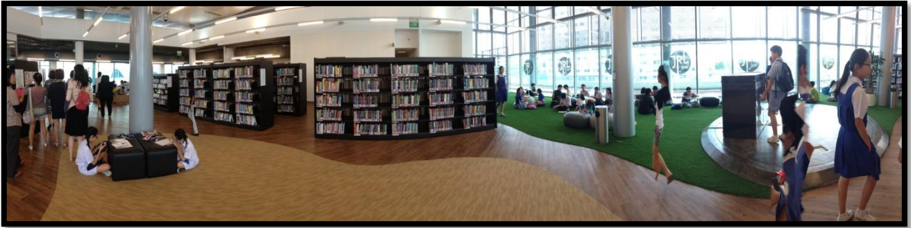
圖 4 裕廊區圖專屬青少年之樓層