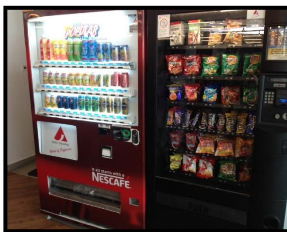
圖 1 裕廊區圖專屬青少年之樓層販賣機

我們所參訪的裕廊區域圖書館，為了扭轉一般青少年對圖書館的刻板印象，建設青少年專屬樓層。當地學生在一點半放學之後，習慣性地到鄰近的圖書館自學或複習，該層還有販賣機，讓