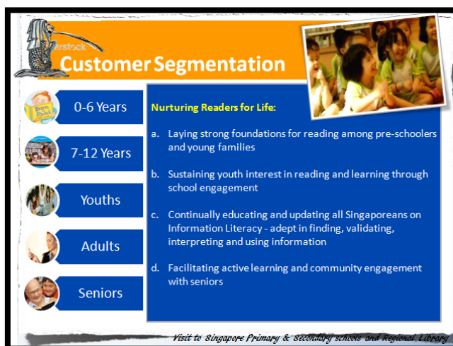
圖 3 新加坡閱讀行銷各年齡層

依據圖 1，橘色是區域圖書館，綠色是具獨立運作特質的地方性圖書館，藍色圖標則是位在購物中心的圖書館，甚為特別。因為鄰近且密集的特色，圖書館儼然已融入新加坡居民生活之中。新加坡圖書館訂定其使命在於賦予知識生命，並善用國家地狹人稠的特色，將人力資源此源泉發揮最大效益，圖書館員的業務不再侷限於被動地等待借、還書，而是以「行銷」態度，從零到三歲幼兒，青少年、成人、以至年長者，於各年齡層皆積極主動推廣閱讀活動，徹底展現其具關鍵性的地位及影響力，進而成為圖書館員最迷人的專業魅力。(可見圖 2)