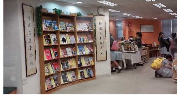
提供豐富多元的閱讀資源