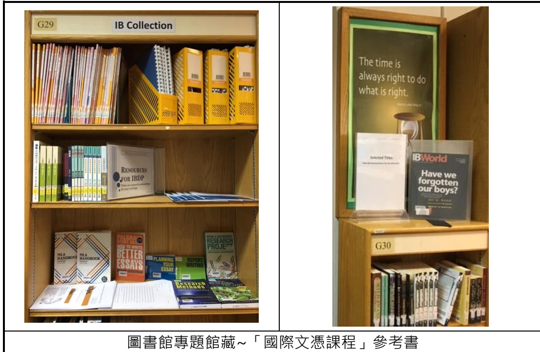
圖書館專題館藏~「國際文憑課程」參考書

此次香港中學圖書館參訪，讓我驚豔震撼的是——香港中學教育是由上而下，在觀念以及制度上對閱讀的重視：一、人力配置有專責的圖書館主任及助理，營造校園閱讀文化，支援學校各部活動，與學科課堂協作。二、經費充足，用來豐富館藏或是設備充實更新，甚至以書券鼓勵學生參加圖書館活動，讓學生可以選擇想看的書入館、擁有一本自己想看的書。三、多元深入的協作課程，閱讀緊密融入各學科教學，提供學科教學所需的圖書，學科老師指導學生廣泛閱讀，設計閱讀報告單，或是配合學科課程內容，設計專題教室、閱讀課程等。