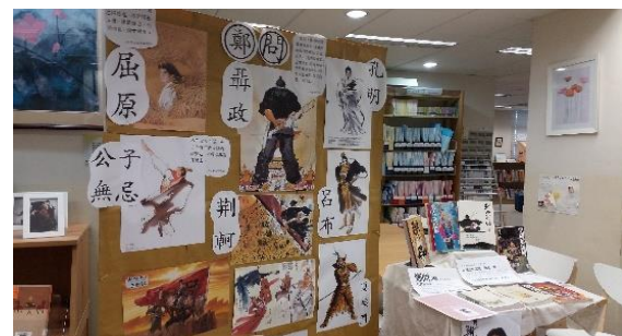
閱讀結合歷史學科的主題展覽