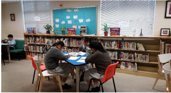
學生們的閱讀自主學習