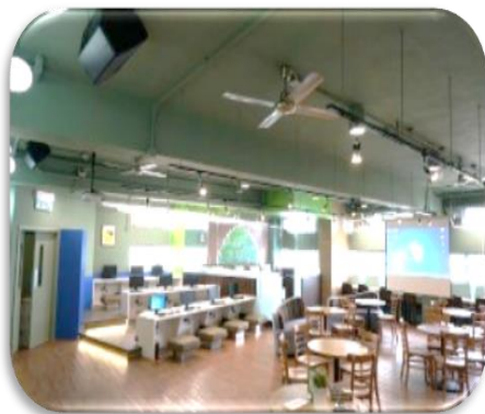
閱讀課上課地點→圖書館