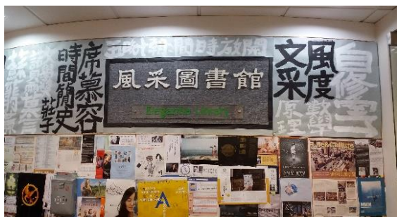
文藝氣息的圖書館正門

學校每周一、二、四、五則安排早讀課，星期三則是安排中英文以外其他科別的延伸閱讀材料，例如：科學、音樂、體育、美術等，都要求學生撰寫閱讀報告，整體而言，全校的課程皆圍繞著閱讀進行，學生已養成「閱讀即是生活」的習慣！