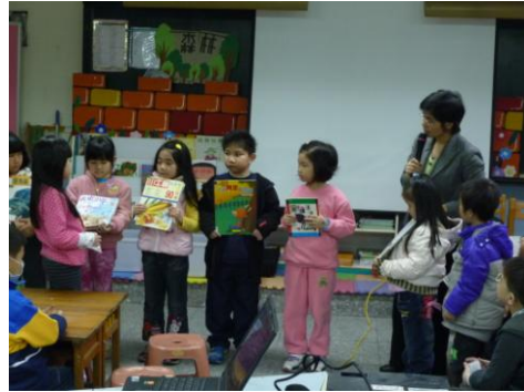
認識各類型出版品(雜誌、報紙、橋樑書)