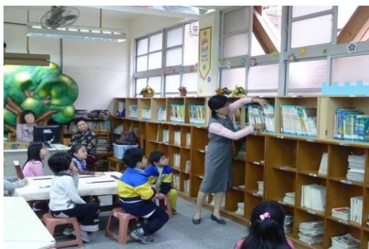
指導使用書插的方式

以實際參觀低年級「奇幻城堡」圖書館，幫助小朋友了解並學會借、還書的方法，也認識各區間的功能及使用方式；並透過遊戲的方式，認識十大分類和排架，學會遵守圖書館的各項規則，讓小朋友能悠游自在的置身書城，流連「奇幻城堡」、穿梭「異想世界」(中高年級圖書館)，享受閱讀不同的時空與樂趣。