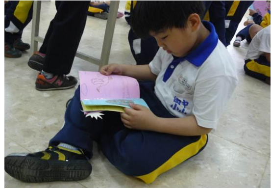
小朋友專注的欣賞同學們的作品