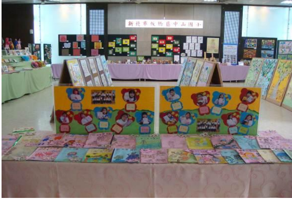
優勝作品於校慶藝文展展出