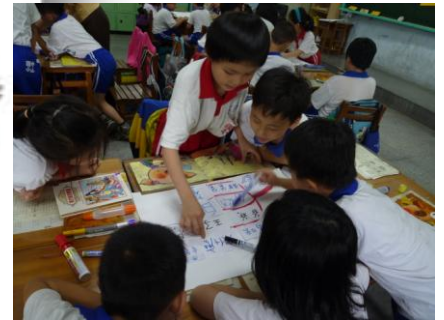
小朋友練習畫心智圖， 並依結構說故事

首先，讓每組小朋友討論並找出故事的第幾頁到第幾頁是「背景」、「問題」、「經過一」、「經過二」、「結果」；其次，讓小朋友一人一段依結構摘要說故事，全組組合起來就是簡單的故事，幾次的操作，連橋樑書都能經由「口語」表達轉化成三分鐘故事；等小朋友熟悉結構之後，就可以開始指導製作小書，做「書面語」的閱讀呈現了。