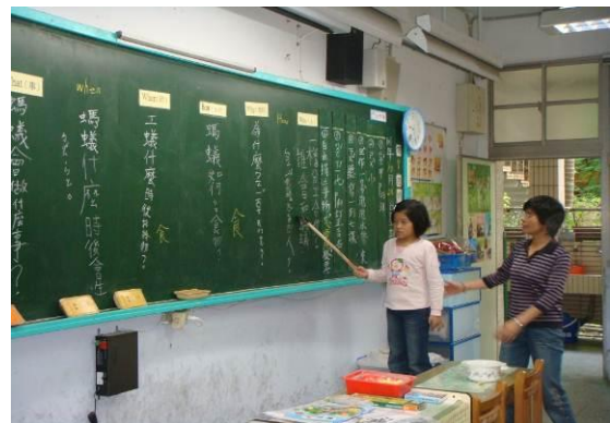
出題者當小老師問同學問題