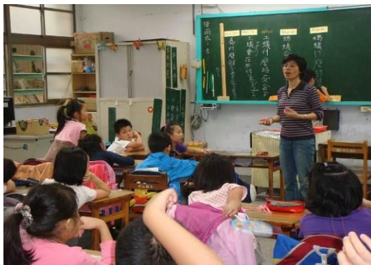
引導小朋友怎樣問問題，問對了寫在黑板上

5. 運用「6W(六何法)」指導小朋友關於螞蟻，如何提出想問的問題，並提醒他們要問問題之前，自己要先想一想：有沒有從文章中的哪一句話可以找得到答案，或者是找不到答案的，幫助小朋友能發現並討論問題，尋找值得探究的問題。