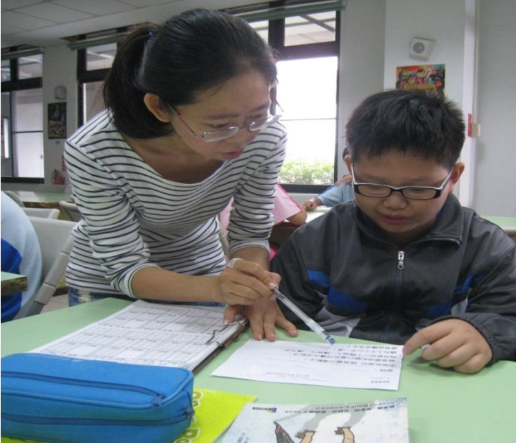
每組抽問---解釋句子前後的關係