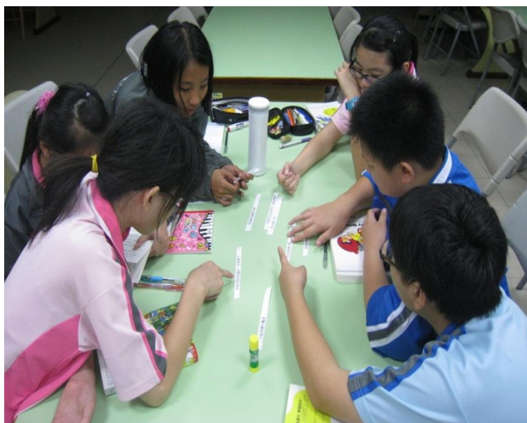
分組討論---連結句子