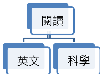
圖一 香港閱讀教育指標

害防制暨租稅、性別平等.....學習的確需要廣度多元視野，然而最核心的學習主軸，究竟要學生帶得走的能力為何？他山之石是我們要思考的地方。