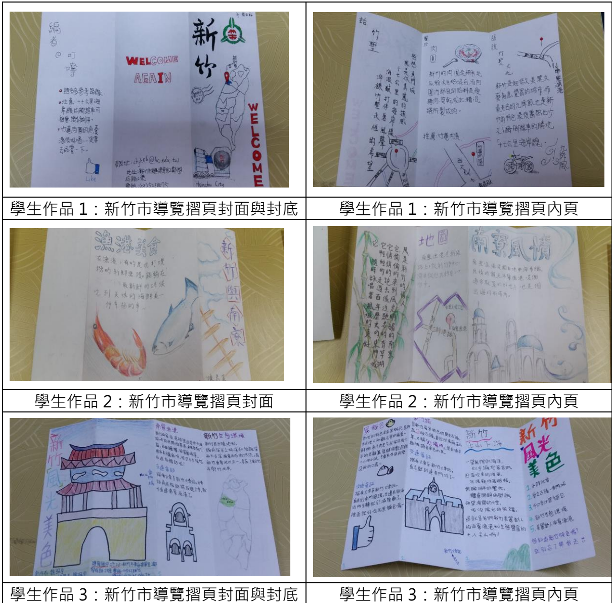
學生作品 1：新竹市導覽摺頁封面與封底

富自己的創作內容，透過大量實作活動練習 Big6 素養，更提升孩子學習動機。願有更多國中老師嘗試 Big6 協作課程設計，用閱讀豐盈孩子的學習視野。