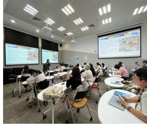
現場與會人員認真聆聽及交流