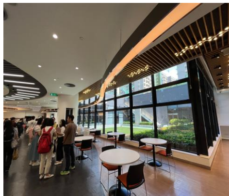
通透明亮且舒適的閱覽空間