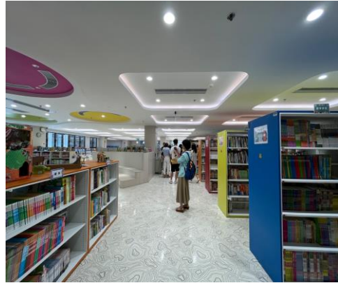
不同高度、色彩的書架