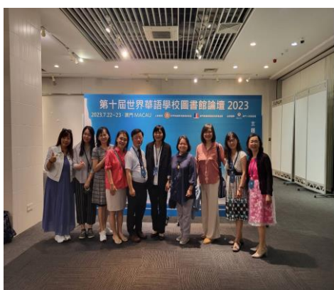
臺灣學校圖書館館員學會與會人員

來自於臺灣、澳門、香港、湖南、浙江、四川、上海、日本等地近百位的圖書館相關從業人員，大家齊聚在澳門，總計發表論文 25 篇，其中臺灣有 9 篇，由臺灣師範大學、海洋大學、臺北市景美高中、臺北市萬興國小的團隊投稿，分別就圖書館管理系統、閱讀能力診斷評量、遠距教學、深度討論法、Podcast 閱讀理解、SDGs 永續閱讀、書目療法、教師閱讀社群、經典閱讀共 9 種主題，提出實證研究或是教學設計，呈現出我國在學校圖書館事業的研究和實務量能，同時也學習不同團體的成果，獲益良多。