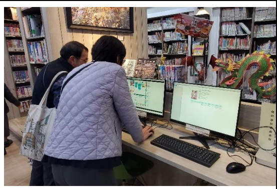
團員操作圖書館館藏查詢系統

座談會上，團員對校內團隊經營中英文圖書館的用心表達讚揚，座談過程也問及公立學校書籍採購經費編列的情形，以及校內教師閱讀推動人力的分工狀況。離校前，十八位專家學者親筆留下珍貴的文字回饋，給予龍安團隊莫大的鼓勵。