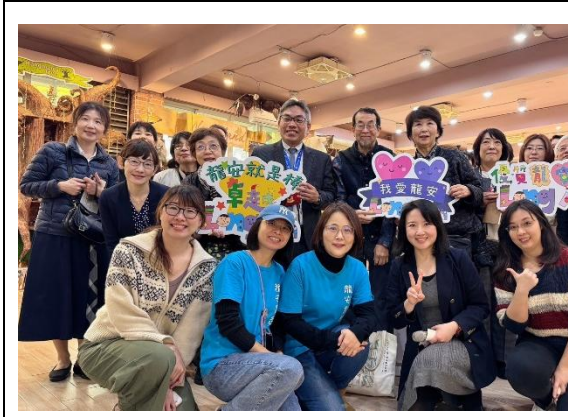
離館前團員與龍安團隊合影留念