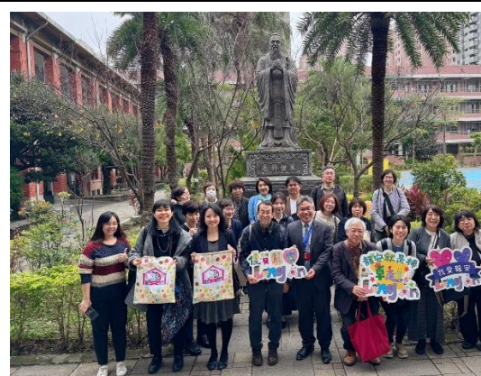
離校前團員於「萬世師表～孔子像」前合影