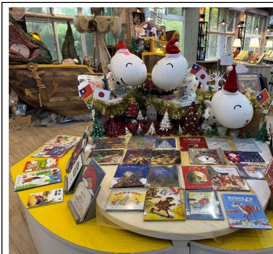
參訪日適逢聖誕假期，入口設置節慶小書展

龍安國小建校於民國十八年，日治時期定名為「臺北市錦尋常小學校」，專供通日語的學生就讀。校內英文圖書館目前設置於具藝術美感及建築史價值之「紅樓」，歷史建築本身為 1933 年興建之磚造建築，屋面為日式黑瓦，微黃色洗石子的建築飾帶，為同期日治學校少見之材料與工法，貴賓蒞校後，由校長引領貴賓參觀校園環境後進入中文圖書館。