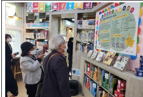
團員參觀《SDGs 永續議題》主題書展情境布置