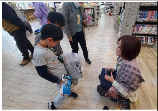
下課時間團員與借書學生進行互動交流