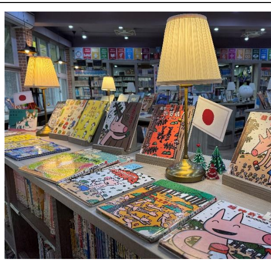
中文圖書館同步陳列日文翻譯童書