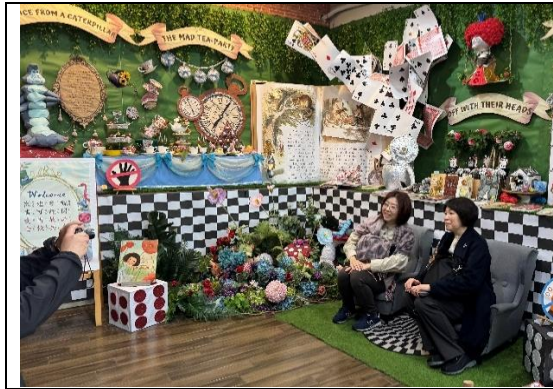
團員參觀《經典文學》主題書展情境布置